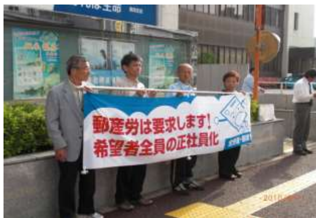
高知局前宣伝行動

四国キャラバンの一環として、6月1日に徳島中央郵便局前での宣伝行動及び郵便事業徳島支店長に要請書を行いました。